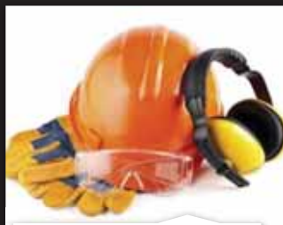
ZAŠTITA NA RADU