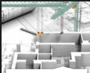
PROJEKTIRANJE MAPE ARHITEKTURA