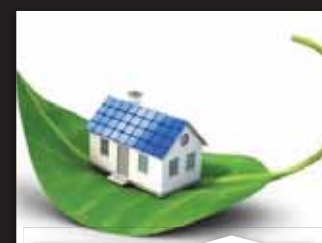
MINIMALNO TEHNIČKI UVJETI