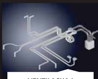
VENTILACIJA I KLIMATIZACIJA