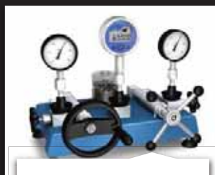
TLAK I TEMPERATURA