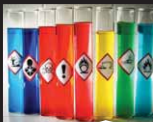
RUKOVANJE OPASNIM KEMIKALIJAMA