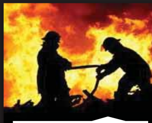
ZAŠTITA OD POŽARA